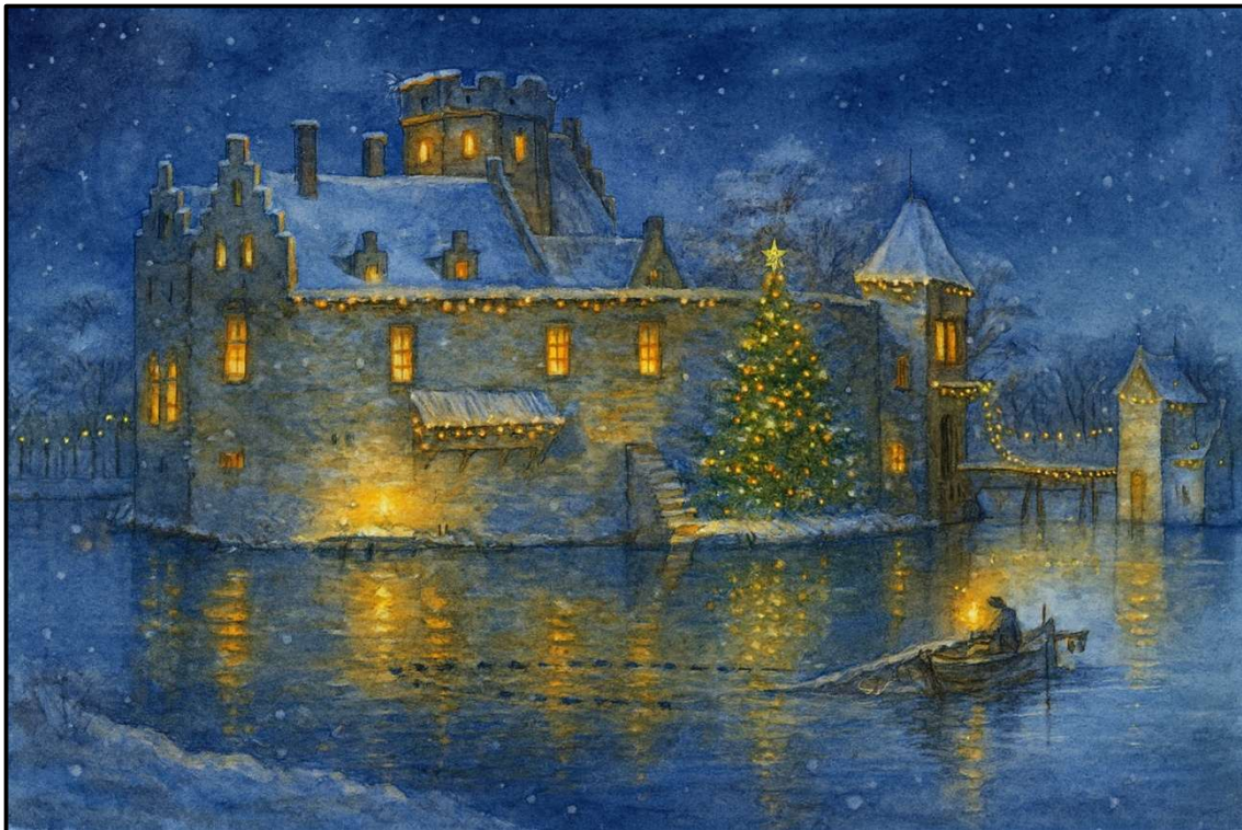
Fijne feestdagen en voorspoedig 2026 met zicht op het kasteel !

Langs deze weg wensen we een ieder fijne feestdagen toe en een voorspoedig en gezond 2026 !