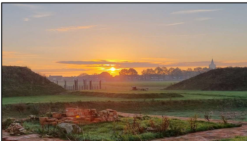
Kasteel van Wouw in de vroege ochtend.

(Een tip: kijk eens op de site van het West Brabants Archief! Een heel groot deel van het kasteelarchief is daar online in te zien).