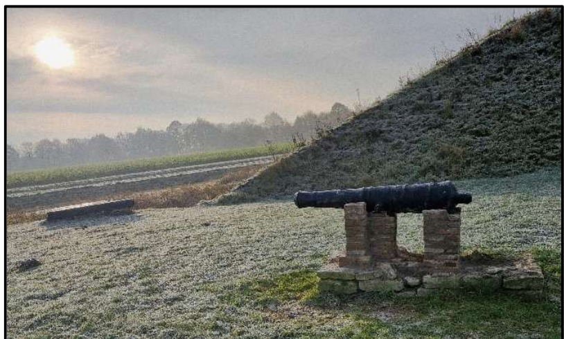
Nieuw onderstel kanon.

De fundatie van de vierkante toren, een latere uitbreiding van de burcht, is uit het water gewerkt en moet over een klein stuk nog afgewerkt worden. Dan kan deze weer jaren mee. Dit jaar is er ook gewerkt aan de doorlaat van de binnen- naar de buitengracht. Dit is een natuurstenen boog die men in het verleden had ondergedekt en kapot had gemaakt door er een